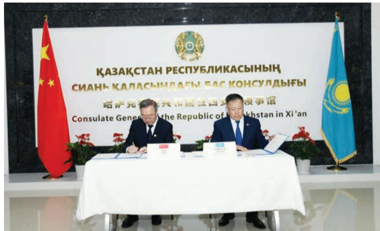
Соңы. Басы 1-бетте

Келісім аясында тараптар ғылыми жарияланымдармен, ақпараттармен, оқытушылар құрамы және ғалымдармен, студенттермен алмасуды, ортақ конференциялар өткізуді, сондай-ақ бірлескен зерттеулерді іске асыратын болады.